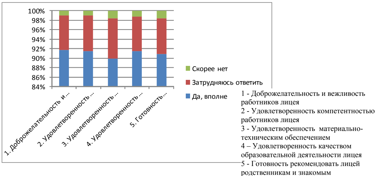
Рис. 1. Нормированная гистограмма результатов анкетирования.

Из анализа приведенных результатов следует, что на начало 2016-2017 учебного года компетентность работников лицея и качество образовательных услуг вполне удовлетворяют учащихся лицея и их родителей (92% респондентов), выявлена неудовлетворенность участников образовательного процесса материально-техническим обеспечением лицея – удовлетворенность продемонстрировали 89% опрошенных. Следует отметить, что наибольшее недовольство состоянием материально-технической базы лицея высказывают родители старших классов (60% опрошенных).